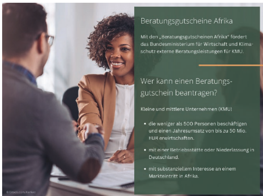
Fig. 4. Consulting Vouchers Africa. // Bild 4. Beratungsgutscheine Afrika.

Die Anmeldung zu den Beratungsgutscheinen ist mit wenigen Schritten unkompliziert über die BAFA-Website ( www.bafa.de/bga ) möglich (Bild 5). Bergbauunternehmen und Unternehmen der bergbauunterstützenden Industrie können die Geschäftsstelle des Wirtschaftsnetzwerks Afrika jederzeit für ein unverbindliches Vorgespräch zur grundsätzlichen Förderfähigkeit des Beratungsvorhabens kontaktieren.