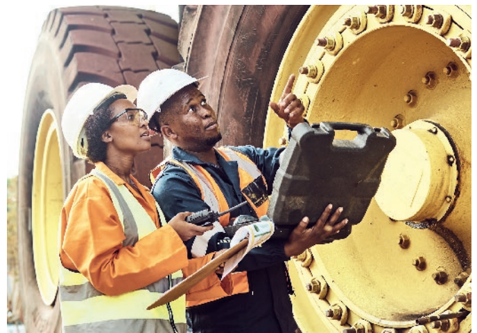
Fig. 2. Miners in front of a dump truck. // Bild 2. Bergleute vor einem Muldenkipper.

Während Länder mit bedeutenden Vorkommen an Rohstoffen, wie z. B. Südafrika, die Demokratische Republik Kongo, Ghana, Ruanda, Guinea und Botswana, im Bereich Bergbau und Ressourcen bereits verhältnismäßig etabliert sind, ist das Potential auf dem afrikanischen Kontinent noch lange nicht ausgeschöpft. Insbeson-