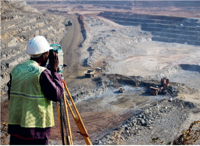
Fig. 1. Surveyor in a copper mine in Zambia. // Bild 1. Landvermesser in einem Kupfertagebau in Sambia.

the BMWK aims to establish sustainable and resilient raw materials chains.